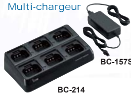
BC-214 Chargeur rapide 6 postes ou batteries