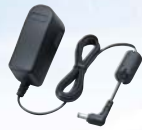
Adaptateur secteur BC-123SE